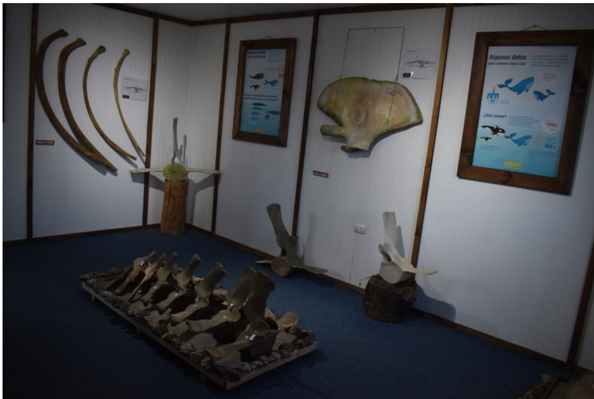
Imagen 4. Exhibición 'Ballena Sei' en Museo de Puerto Rio Tranquilo.

vés de la gestión de exhibiciones y actividades de extensión realizadas desde su reapertura en el 2019, vuelve la mirada a memorias de vida de pobladoras/es, sensibilizando sobre su contexto social a quienes llegan a la localidad masivamente a visitar las célebres Capillas de Mármol (Palominos et al., 2019).