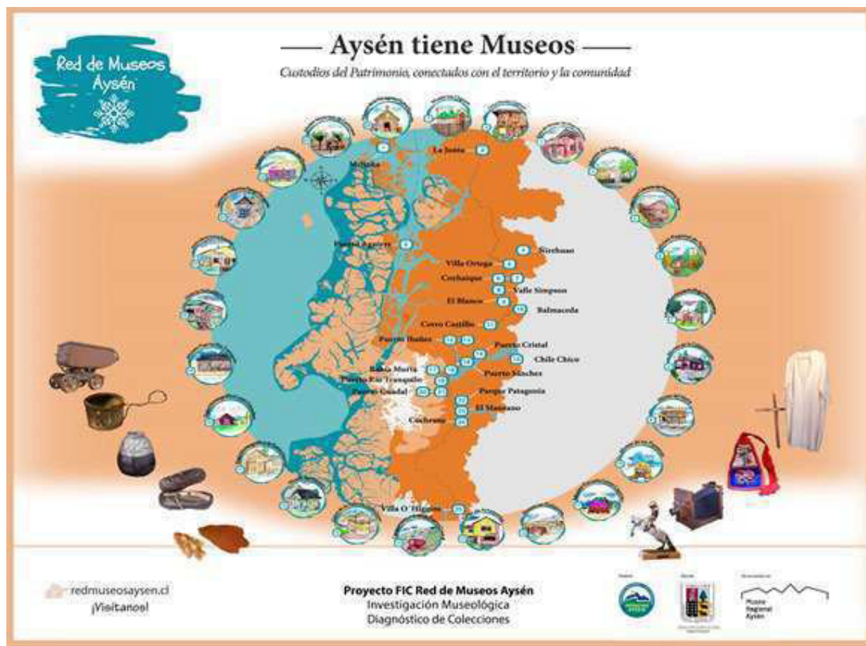
Imagen 1: Mapa de difusión del proyecto Red de Museos Aysén.

Estos rasgos han tenido una repercusión en la consolidación de sus museos, en su mayoría de base comunitaria. De igual forma, el aislamiento, la tradición y la geografía extrema han sido integradas de explícitamente a las dinámicas de éstos a través de acciones adecuadas al contexto (Imagen 1). Su corta trayectoria refleja que son proyectos comunitarios para enfrentar el aislamiento mediante un fuerte énfasis en la identidad local (Rojas & Sade, 2019).