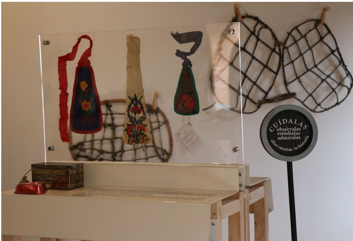
Imagen 2. Sala de los pioneros. Museo de Cochrane.

Las funciones que han adoptado responden a necesidades surgidas desde el aislamiento. Por ejemplo, unos funcionan como centros complementarios de integración en torno a distintos hitos del patrimonio cultural y natural, especial en comunidades alejadas de la capital regional (n=17) (Imagen 2). En paralelo, se destacan (n=2) museos de antiguos campamentos mineros que enfocan sus acciones en rescatar memorias asociadas al patrimonio industrial y a la minería como proceso (Imagen 3). Existen los levantados por agrupaciones que ejercen la protección de recursos naturales mediante el activismo y promoción de la cultura y de la ecología (n=4).