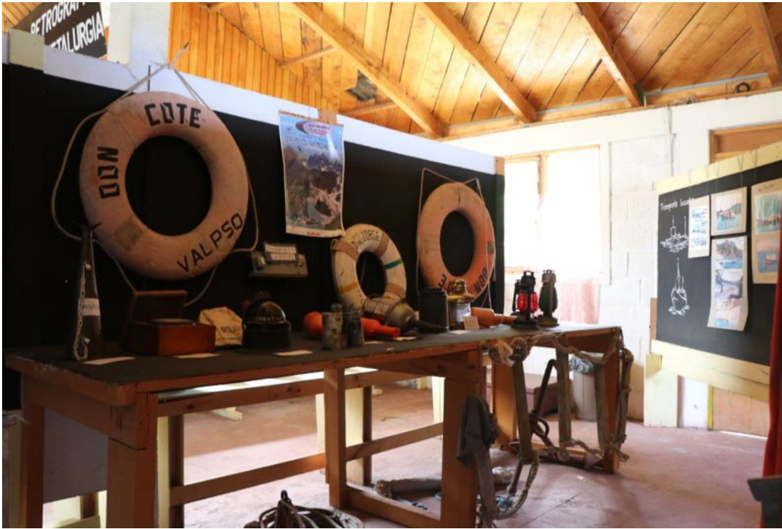
Imagen 3. Navegación y pasado minero en Lago Chelkeno, Museo Minero de Puerto Sánchez.